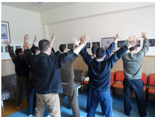
Pillanatkép a próbáról