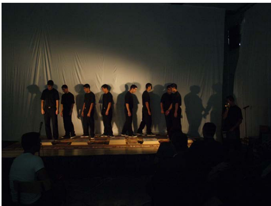
„Felszállt a füst és eltakarta a napot” Debreceni fiatalok előadása

A köszöntéseket követően az intézmények művészeti szakkörei mutatták be a produkcióikat. Minden előadás nagyszerű és egyedi volt!