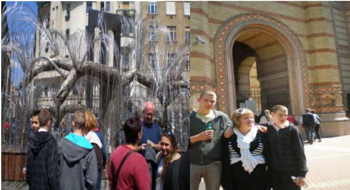
A Rákospalotai Leánynevelő képviselői

A látogatás során találoztunk tőlünk Aszódra került növendékekkel is. Jó volt velük is beszélgetni, többen közülük nálunk is állandó résztvevői voltak rendezvényeinknek.