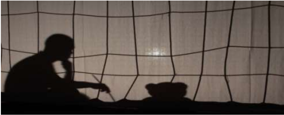
„El nem küldött képeslapok” című árnyjáték Budapesti Javítóintézet, 2014.

A Pharrajimos , a vészorszak roma származású áldozatainak napján rendeztük meg a pályázatban részt vevő fiatalok közösségi találkozóját, a Debreceni Javítóintézet rendezésében . Tekintettel arra, hogy a Budapesti Javító intézet növendékei személyesen nem jelenhettek meg a rendezvényen, olyan bemutatkozási formát kerestünk, amivel felkelthetjük érdeklődését a többi pályázatban résztvevő fiatalnak és felnőtt munkatársaiknak. Így gondoltunk az árnyjáték filmre vitt változatára .