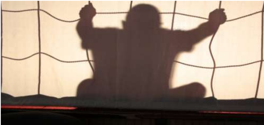
„El nem küldött képeslapok”, B. Ferenc Budapesti Javítóintézet, 2014.

Az „El nem küldött képeslapok” című árnyjáték főhőse egy 4-5 éves kisfiú, akit elszakítottak szüleitől, és nem kerülhetett haza, vissza a családjához . A darabnak egy látható szereplője van, de az árnyjáték elkészítésében 12-en vettek részt.