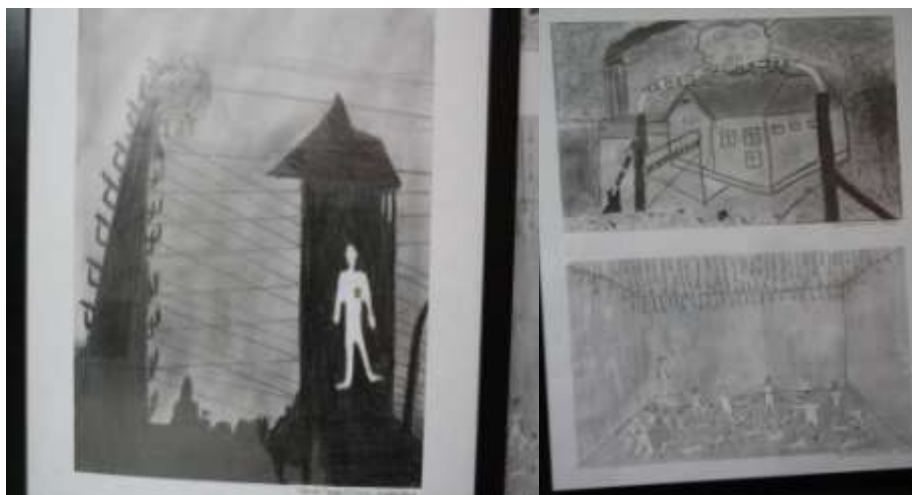
A kiállítás képeiből: Budapesti Javítóintézet, 2014.október