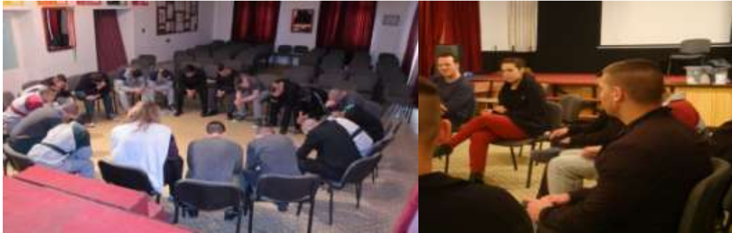
A Haver Alapítvány foglalkozásai,