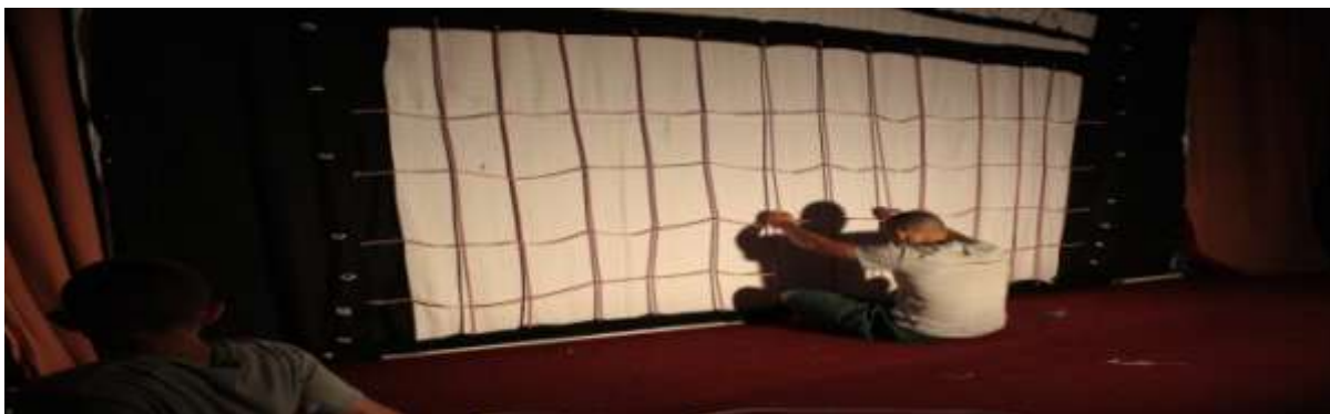
„El nem küldött képeslapok” próbáján, B. Ferenc