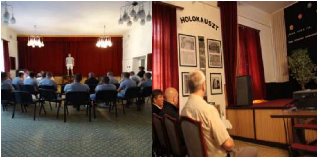
Radnóti Miklós: Levél a hitveshez